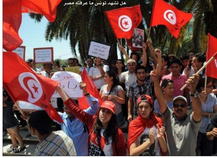
هل تشهد تونس ما عرفته مصر

بعد نجاح حملة تمرد في مصر من تحقيق أهدافها عبر التعبئة الشعبية، تعالت أصوات تونسية لإعادة السيناريو المصري في تونس بإطلاق حملة تحمل اسم تمرد تونسية، وجدت مساندة ضمنية وجدت ترجمتها في مطالبات كبرى الأحزاب التونسية بتشكيل حكومة إنقاذ وطني ودعوتها إلى حل الحكومة والمجلس التأسيسي. هذه الدعوات أثار جدلا وتباينا في المواقف توزعت بين المساندة المطلقة والرفض القاطع وبين القائلين بتشابه الأوضاع والمؤكد لاختلافها، وتباين تجربة ومسار عملية الانتقال السياسي في مصر وتونس. ويرى مراقبون أن لهجة ردود أركان الحكم على هذه الدعوات تشي بارتباك ما وخوف من احتمال انتقال العدوى المصرية إلى الربوع التونسية. غير أن آخرين يرون أن تشتت المعارضة في تونس وضعفها، قد يحرم تمرد التونسية الناشئة من سند أساسي يقلل من فاعليتها، لكن هناك من يرى في بيانات أحزاب المعارضة الأخيرة ووحدة مضمونها ومطالبها مؤشر يوحى بان السيناريو المصري في طريقه إلى التجسيد في تونس.