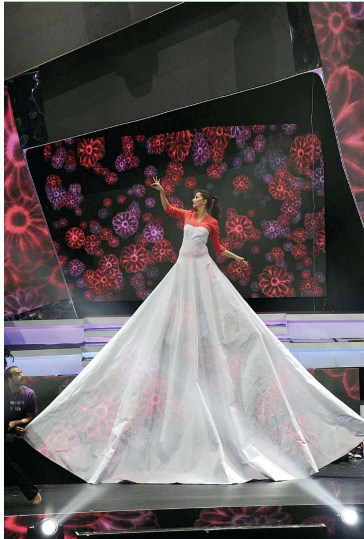
ممثلة بوليوود الهندية مادري ديكسيت نبتي تؤدي عرضاً في حفل توزيع جوائز IIFA السنوية السنوية في مكاو الصينية. (ا ف ب)

أقدم صبي لم يتعدى عمره الـ7 سنوات على سرقة سيارة في وسط روسيا، وقادها عدة أمتار قبل أن يصطدم بسيارات أخرى ويدس ولدين من عمره تقريبا. ونقلت وكالة الأنباء الروسية نوفوستي ان صبياً في السابعة من العمر لاحظ وجود سيارة نافذتها مفتوحة ومفتاحها بداخلها في مراب للسيارات، فقرر أخذها للقيام بجولة. وأشارت إلى ان الصبي، الذي كان يقود، في نزهته نوفورود، وهي خامس أكبر مدينة روسية، تمكن من قيادة السيارة أمتاراً قليلة قبل أن يصطدم بسيارات ويدس فتاة وصبياً من عمره. وأوضحت الشرطة ان الولدين المصابين في المستشفى لكنهما في وضع مستقر.