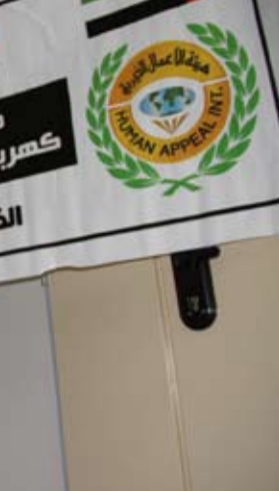
هيئة الاعمال الخيرية الاماراتية تنفذ مشاريع انتاجية لصالح الأيتام والكفيفين في فلسطين

وعبر مسؤولون فلسطينيون وأسمهات أيتام نالهم نصيب من هذا المشروع الانساني عن تقديرهم الكبير لدولة الامارات وهيئة الاعمال الخيرية على هذه اللفتة الانسانية الكريمة التي