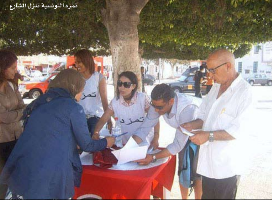
تمرد التونسية تنزل الشارع

بعد نجاح حملة تمرد في مصر من تحقيق أهدافها عبر التعبئة الشعبية، تعالت أصوات تونسية لإعادة السيناريو المصري في تونس بإطلاق حملة تحمل اسم تمرد تونسية، وجدت مساندة ضمنية وجدت ترجمتها في مطالبات كبرى الأحزاب التونسية بتشكيل حكومة إنقاذ وطني ودعوتها إلى حل الحكومة والمجلس التأسيسي. هذه الدعوات أثار جدلا وتباينا في المواقف توزعت بين المساندة المطلقة والرفض القاطع وبين القائلين بتشابه الأوضاع والمؤكد لاختلافها، وتباين تجربة ومسار عملية الانتقال السياسي في مصر وتونس. ويرى مراقبون أن لهجة ردود أركان الحكم على هذه الدعوات تشي بارتباك ما وخوف من احتمال انتقال العدوى المصرية إلى الربوع التونسية. غير أن آخرين يرون أن تشتت المعارضة في تونس وضعفها، قد يحرم تمرد التونسية الناشئة من سند أساسي يقلل من فاعليتها، لكن هناك من يرى في بيانات أحزاب المعارضة الأخيرة ووحدة مضمونها ومطالبها مؤشر يوحى بان السيناريو المصري في طريقه إلى التجسيد في تونس.