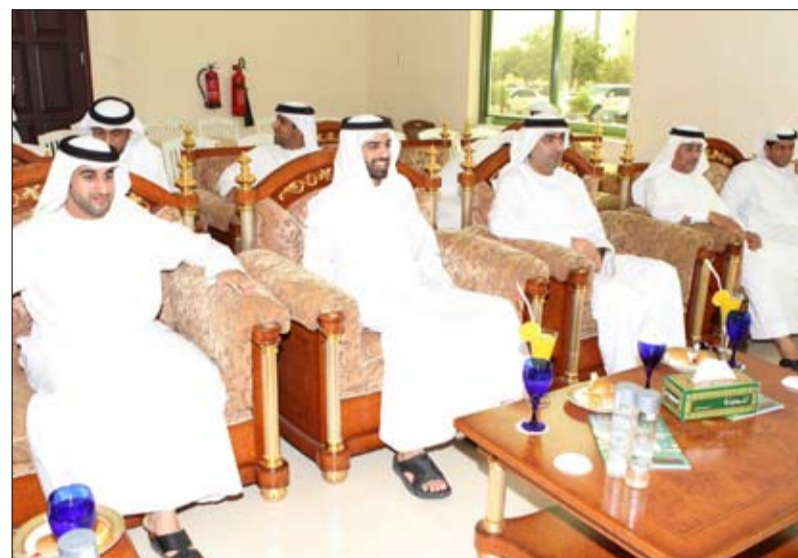
أشاد برعاية محمد بن زايد