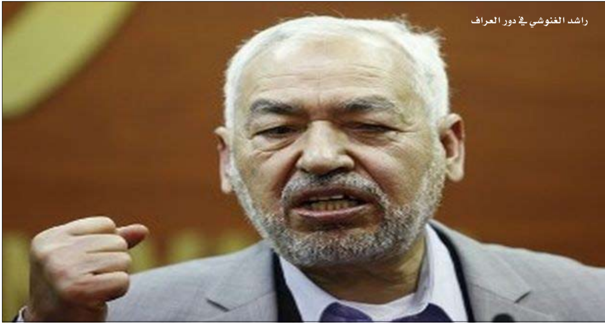
راشد الغنوشي في دور العراف

هوغو تشافيز ثم أعاده الشعب الفينزويلي إلى سدة الحكم. وقال راشد الغنوشي بأن هناك من يريد أن يجذب التاريخ إلى الوراء بينما يتقدم التاريخ إلى الأمام. ويشار إلى أن الحكومة التونسية التي يتزعمها قيادي من حزب النهضة قد عبرت، أمس الأول،