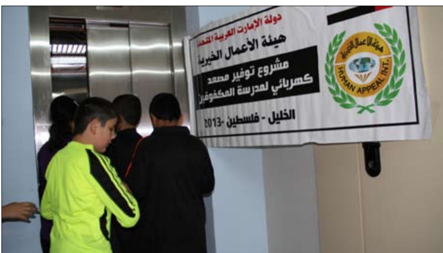
هيئة الاعمال الخيرية الاماراتية تنفذ مشاريع انتاجية لصالح الأيتام والكفيفين في فلسطين