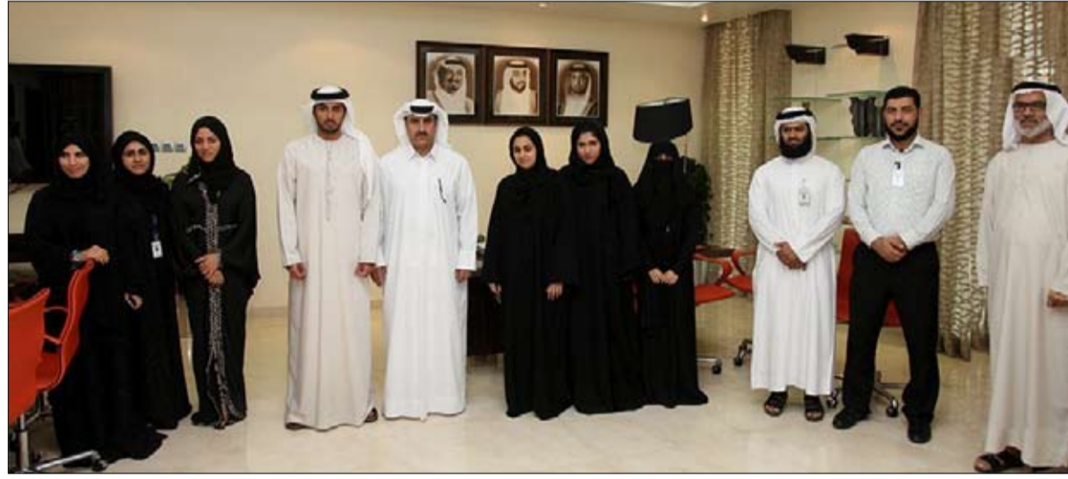
تطوير خدمات الدائرة ويضيفون قيمة لخدماتها من خلال إعطاء صورة إيجابية ومشرفة عنها في كافة المحافل والمناسبات أمام قريناتها من البلديات في الدولة ما يجعلها محط أنظار الجميع واهتمام العالم بها لما تتميز به من خدمات فضلى وما تطبق

الأفضل الممارسات في العمل البلدي وسعيها الدائم لتقديم أفضل الخدمات للمتعاملين في الإمارة. وأعرب عن سعاده بوجود مثل هذا الفريق المبدع في صفوف الموظفين وهذه الإدارات المتميزة القادرة على تحمل المسؤولية الوطنية بالتنسيق مع كافة الفئات الوظيفية بالدائرة مترجمين بذلك رؤية ورسالة الدائرة وفق تطورات القيادة الرشيدة بعجمان خاصة والقيادة العليا بالإمارات بشكل عام وبما يسهم بشكل ملموس في تحسين نوعية الحياة بالإمارة ويحافظ على مسار دائرة البلدية والتخطيط بالتميز المؤسسي ويحقق لها المزيد من النجاحات.